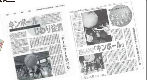
2010年度 メディア取材数113件