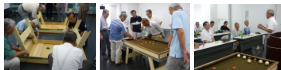
←2013年前回講習会より。左から組み立て、審判の仕方、競技規則を学ぶ。

日本バンパープール協会公認審判員として、指導や普及に携わっていただく審判員講習会、第9回「初級審判員講習会」ならびに第6回「上級審判員講習会」を開催いたします。多くの日本バンパープール協会会員の参加をお待ちいたします。