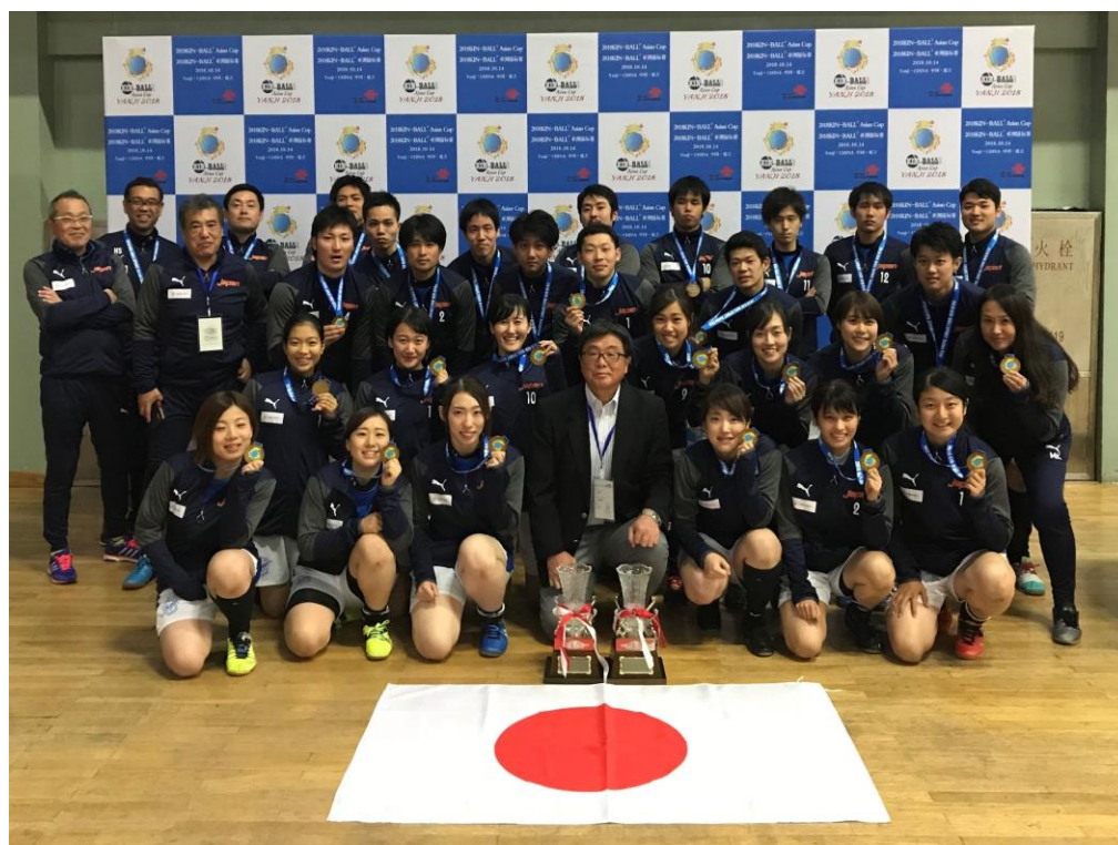
第2回キンボールスポーツアジアカップ2018 男子の部、女子の部 優勝 日本