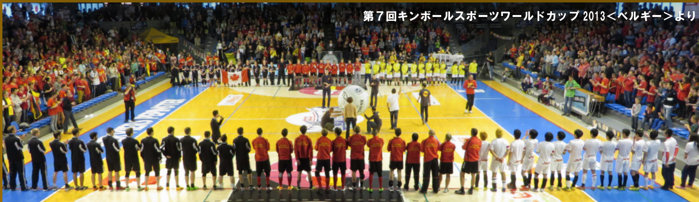
第7回キンボールスポーツワールドカップ 2013<ベルギー>より

(一社)日本キンボールスポーツ連盟は2015年にスペイン・マドリードにて開催される「第8回キンボールスポーツワールドカップ 2015」に日本選手団を派遣いたします。日本選手団の渡航および現地滞在にともない、寄付金をお願いすることとなりました。今回も寄付金は全額を日本代表選手、ヘッドコーチ、アシスタントコーチ、トレーナーに渡航費補助として渡します。